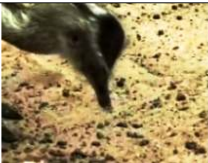
een emoe is een loopvogel