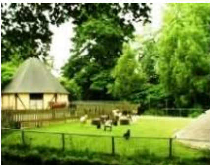
de wei met geiten...

Dit filmpje gaat over het werk en de dieren in de Dierenwijck.