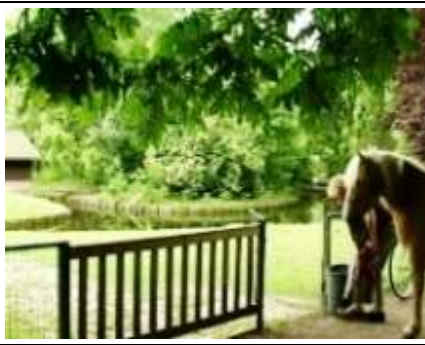
dan mag het mee