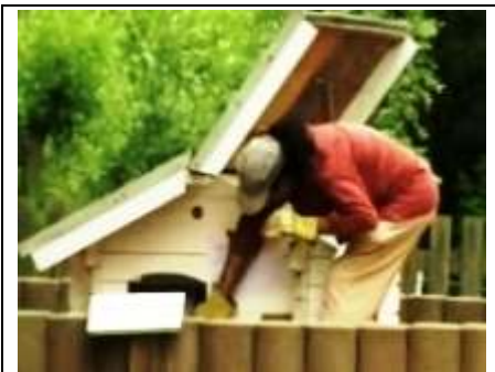
het hok wordt geпоetst