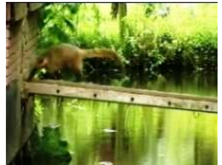
een kleine tapir