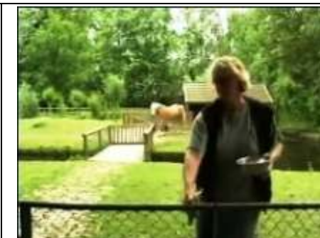
daar komt het aan