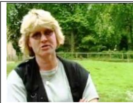
de verzorger van de dieren