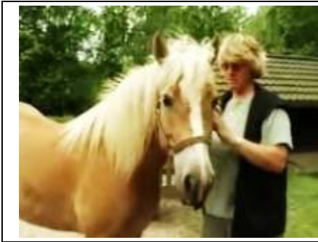
het paard wordt verzorgd