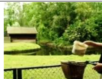
extra voer voor het paard