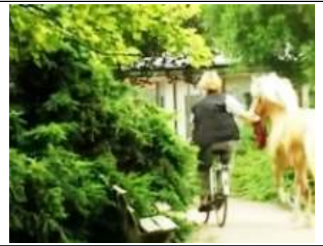
naast de fiets