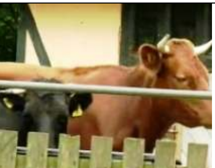
een kalf met een oormerk