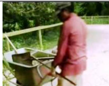
de verzorger met de kruiwagen