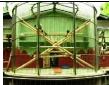
de apen samen in de kooi