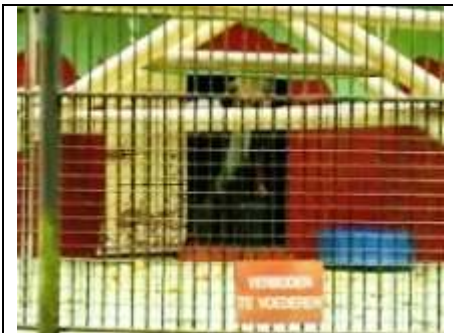
wat staat er op het bord?