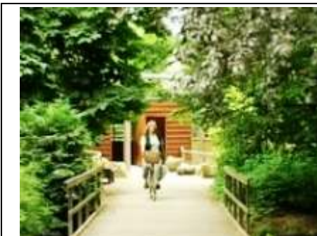
op de fiets gaat sneller