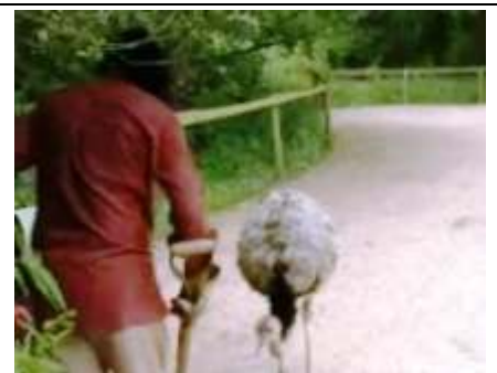
de poep wordt opgeruimd