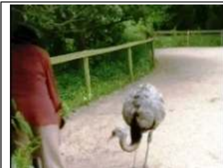
de emoe is nieuwsgierig

Je gaat vaak laat naar huis. Bijvoorbeeld als een dier ziek is.