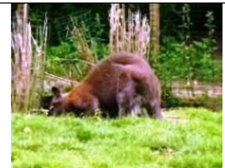
er is ook een kangoeroe