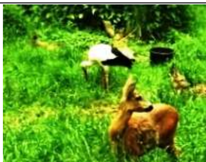
een ooievaar bij de reeën