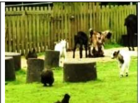
zie je de kippen?