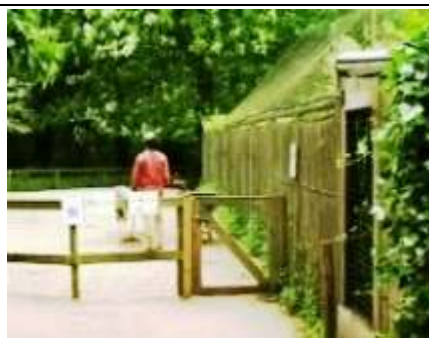
even een dier knuffelen