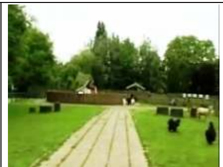
er is veel ruimte